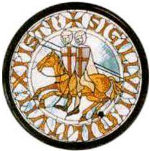
Sello de los Caballeros Templarios