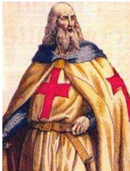
Jaques de Molay

Los Templarios intentaron inútilmente desde Chipre, reconquistar cabezas de puente para su presencia en Oriente medio, no siendo acompañados por las otras órdenes (los Hospitalarios ni los Caballeros teutónicos). El Maestre Jaques de Molay se dirige a Francia para probar convencer al Rey de Francia la organización de una nueva cruzada.-.