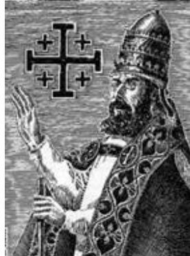
Papa Urbano II

El Conde Hugo de Vermandois, hermano del rey de Francia Felipe I, organiza la primera cruzada reconquistando en el año 1098 a Jerusalén que queda bajo el mandato del Rey Beduino I.-