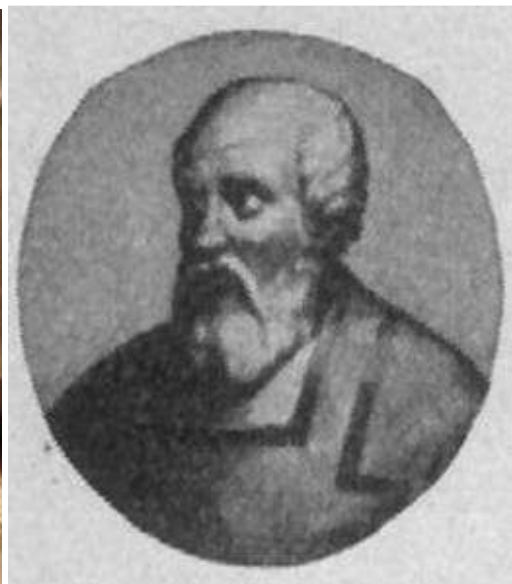
Papa Honorio II